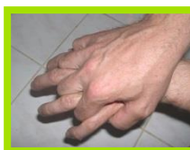
Dos des mains et espaces interdigitaux