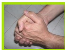
Paume contre paume

Un temps de friction de minimum 30 secondes (séchage complet)